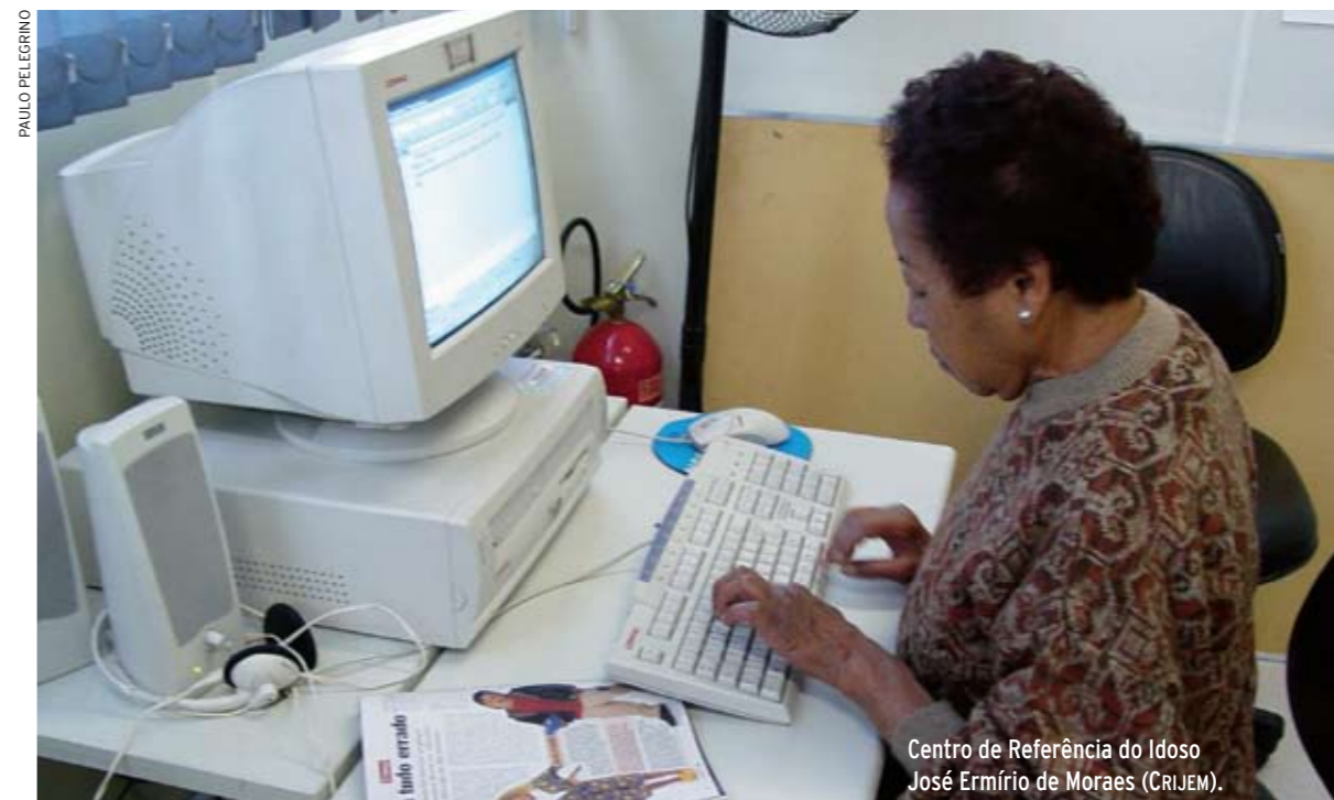
Centro de Referência do Idoso José Ermírio de Moraes (CRIJEM).

O próprio desenvolvimento progressivo da tecnologia e da internet leva à ampliação do número de pessoas excluídas, ao estimular novas formas de desigualdade, uma vez que a maioria não possui computador.