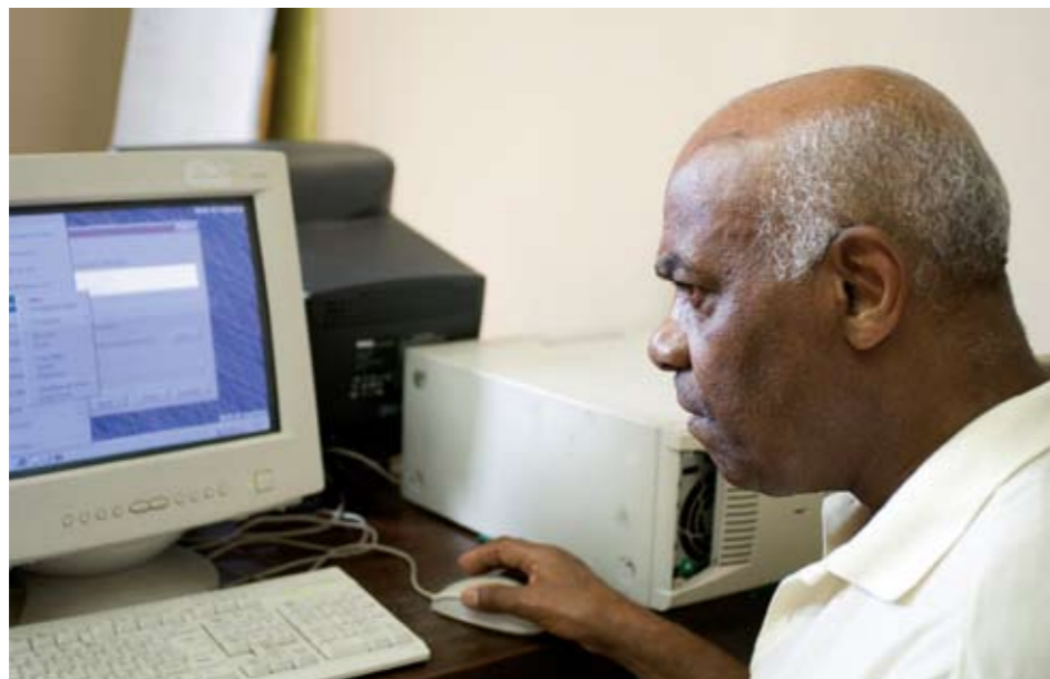
Aula de informática no Movimento Pró-Idosos (MOPi).

10% dos idosos entrevistados usavam o computador, dos quais 3% continuamente e 7% algumas vezes, e 4% acessavam a internet, 1% com frequência; 29% tinham interesse por computador e 24%, pela internet; 44% gostariam de fazer algum curso, 6% deles de informática.